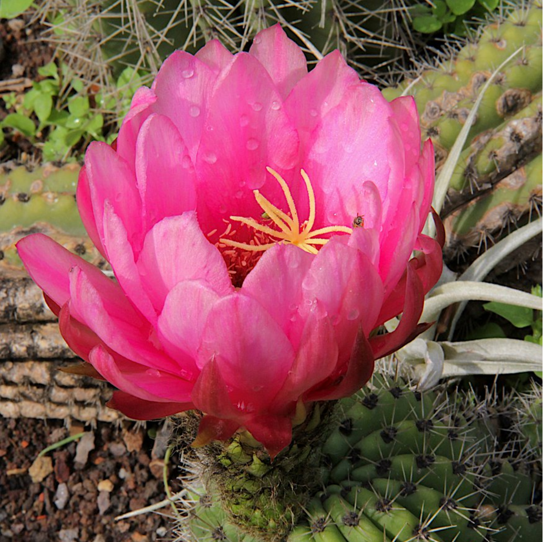
Echinopsis x imperialis